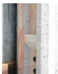
Detalle de Ménsula