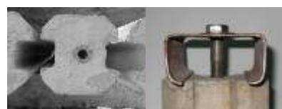
Detalle de Solera

Para mayor información, consulte nuestro Manual Técnico PC.